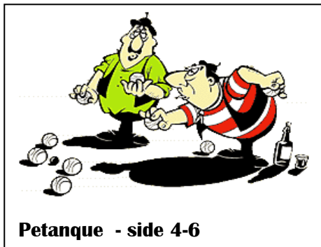
Petanque - side 4-6