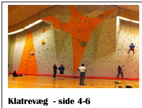
Klatrevæg - side 4-6