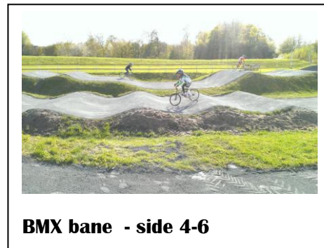
BMX bane - side 4-6