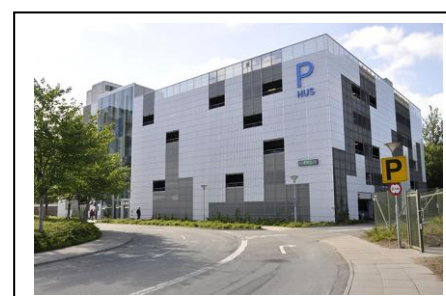
Er der plads til dig? - side 4-6