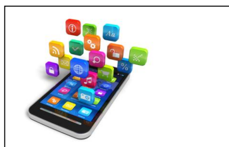
Alt i én, én i alt - side 4-6