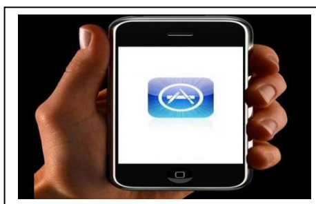
Find os på App Store - side 4-6